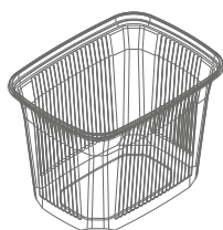
Pojemnik 108 R