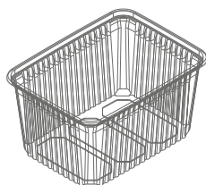
Pojemnik RE 180